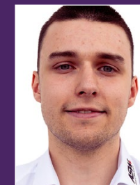
Noah Bauer Leasingrücknahme Großkunden

T: 07132 389-185 E: anna.lutsch@ asw-automobile.de